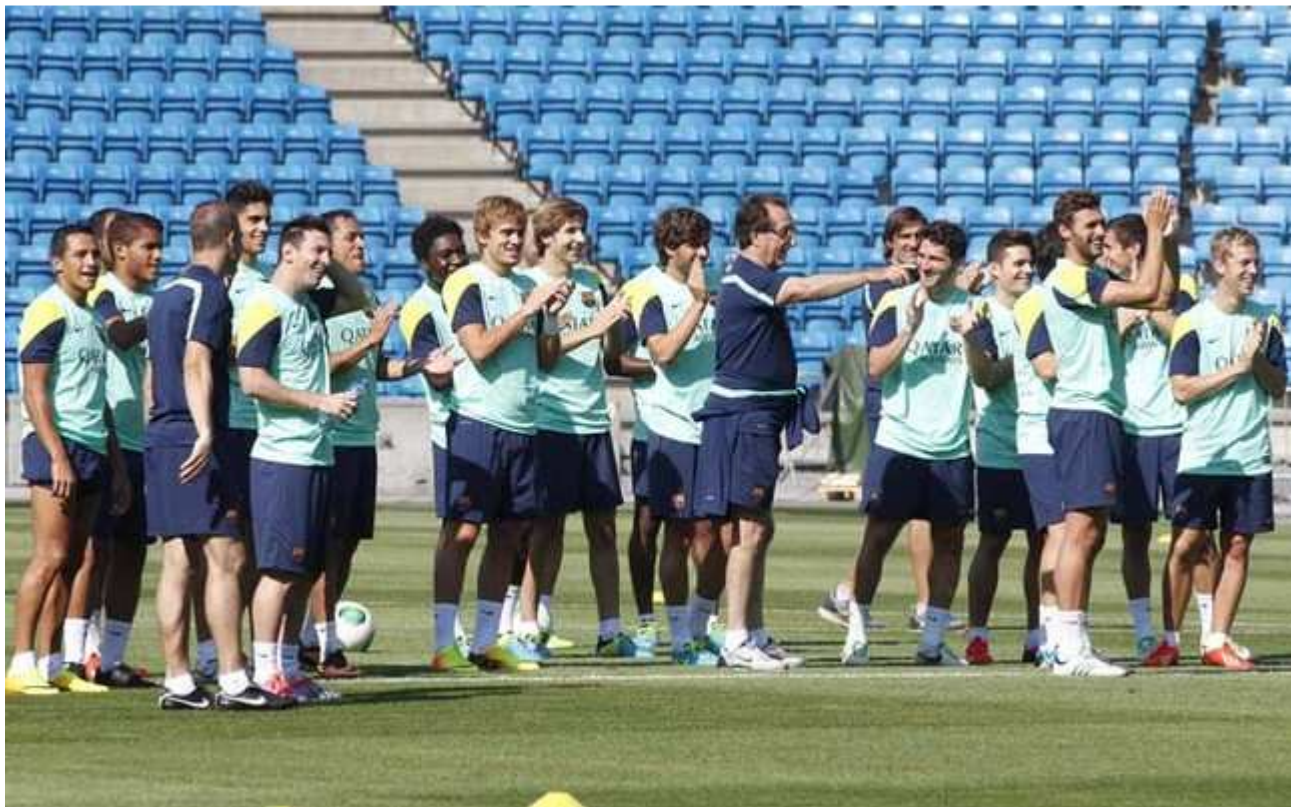
Paco Seirul.lo en una sesión de entrenamiento de la temporada pasada

El mayor experto mundial en la preparación deportiva, Paco Seirul.lo, impartió una clase magistral sobre la innovación en la metodología de trabajo